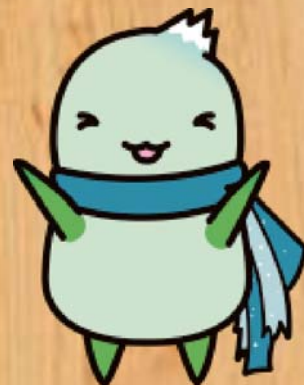
養父市イメージキャラクター やっぷー

既に影響を見せ始めている地球温暖化を防止するためには、私たち一人ひとりがCO 2 の排出を抑えることと同時に、CO 2 を光合成により吸収して成長し、幹や枝に蓄えるなど地球の温暖化防止に大きく役立つ森林を守り、育てていく必要があります。